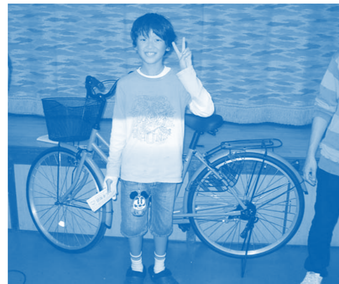
自転車がありました！ いいなあ