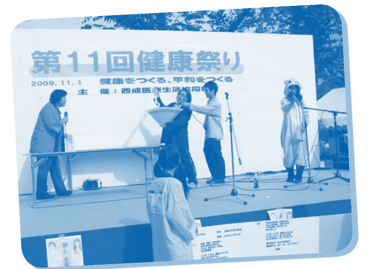
公園全体をつかったユニークな変装と 替え歌はニコニコ介護センターさん