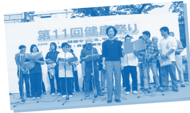
歌おう会の声は公園全体を 温かい笑顔に