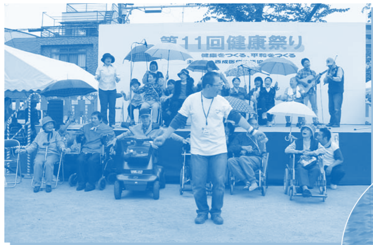
デイケア利用者さんと 職員のうた体操