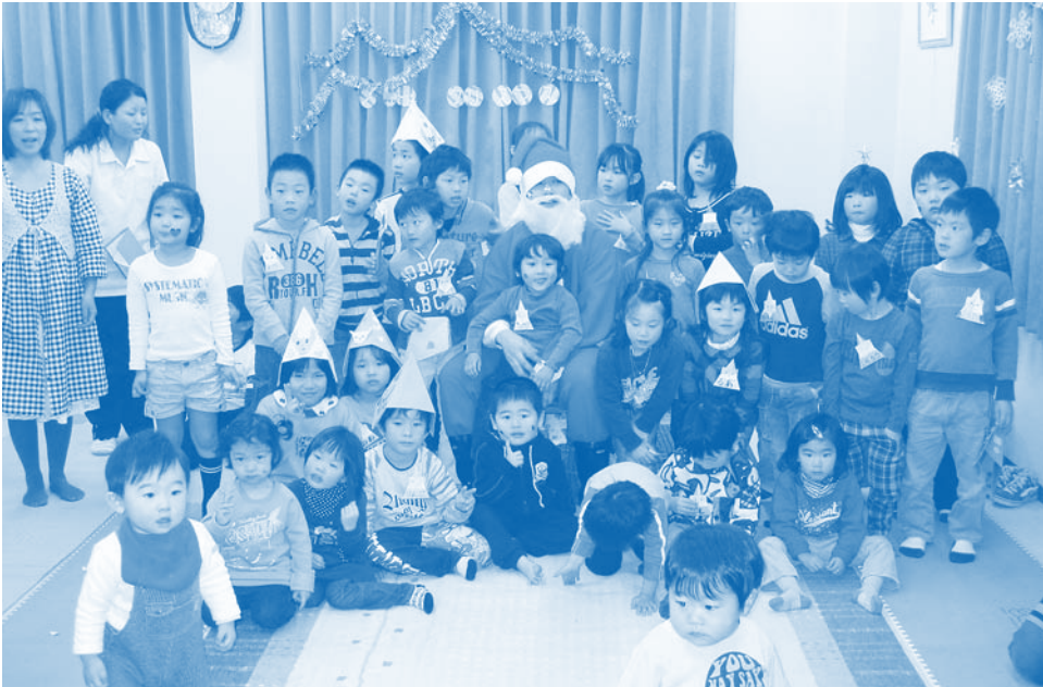
12月19日(土) こつまの里4階で小児科クリスマス会を開催。36名のこども達と楽しいひと時を過ごしました。 元気な時は楽しく集い、病気の際は安心して預けられる病児保育室「まつぼっくり」をよろしくお願ひします。

<発行所>大阪市西成区聖天下1-10-26 本部 ☎06-6658-7400 <発行責任者>奥 章 http://www.nishinari.coop/ 2010年1月号 第206号 【現 勢】 組合員数 7,884人 出資金額 179,827千円 2009年11月末日現在