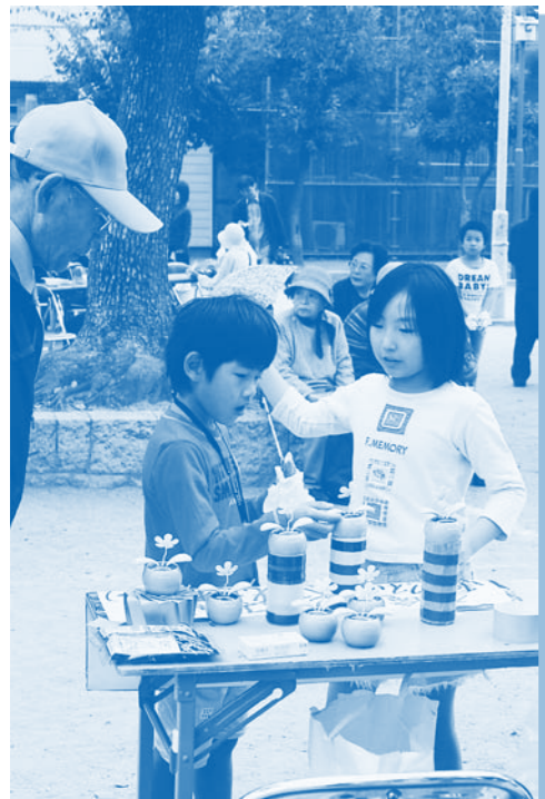
咲いているのは笑顔の花と 健康の花です！