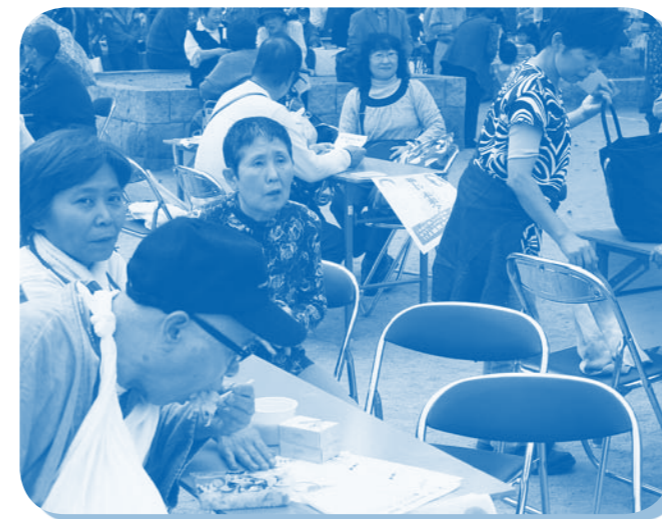
舞台上に夢中、食べるのに夢中