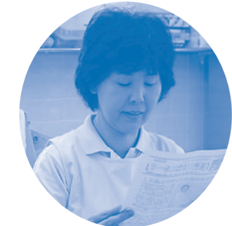
支部長からの活動報告

5月〜6月上旬にかけて各支部が一斉に支部総会を行いました。組合員さんに総会の出席を呼びかけ、食事を出したり、おやつを出したり、組合員さんに総会に来てもらえるように各支部がそれぞれ工夫をして総会を行いました。 南津守支部では、5月29日(日)南津守6丁目の市営住宅の集会場をお借りして、組合員さんが中心となって総会の準備をしました。当日は雨でしたが、16名集まり、支部の活動を参加者で共有しました。南津守支部は、診療所か