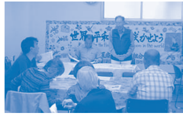
聖天下・天下茶屋合同支部総会