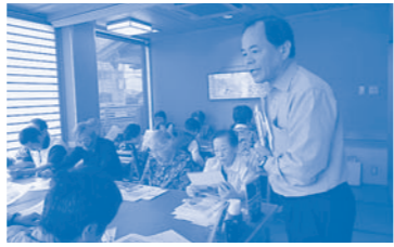
千本中南支部総会