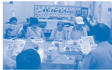
天下茶屋東支部総会