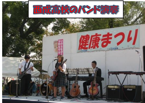
西成高校のバンド演奏