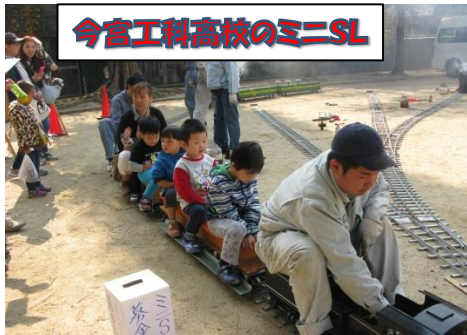
今宮工科高校のミニSL

11月5日(日)晴天の中、第19回健康まつりを開催！ご協力ありがとうございました！