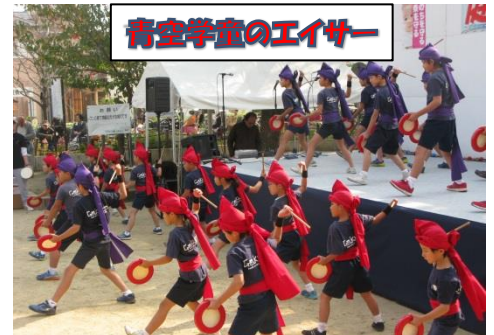
青空学童のエイサー