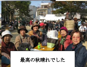
最高の秋晴れでした