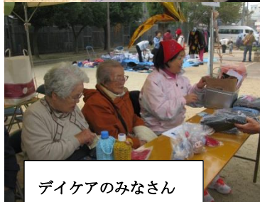
デイケアのみなさん