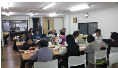
浪速支部 (5月13日開催)