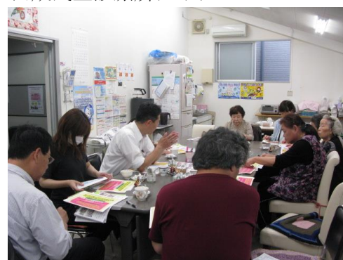
天下茶屋東支部 (5月2日開催)