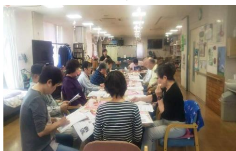
西北支部 (4月29日開催)