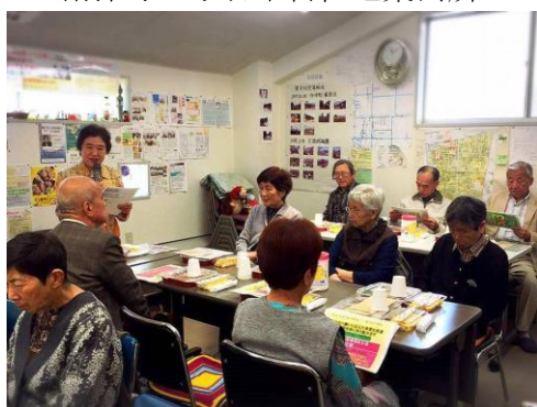
天茶・聖天下支部 (4月28日開催)