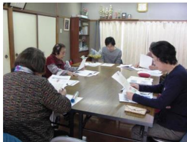
千本中南支部 (4月20日開催)