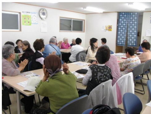
千本北支部 (5月12日開催)