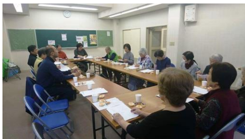
南津守支部 (4月15日開催)