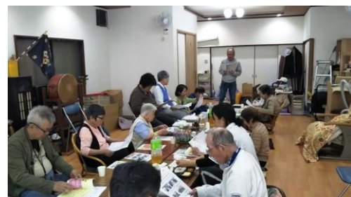
潮路支部 (5月14日開催)