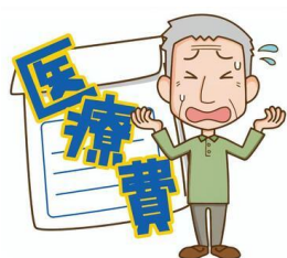
無料低額診療 利用の流れ

今回のテーマは、『無料低額診療事業とは』です。困っている方が安心して医療を受けるための制度であり、医療福祉生協の『地域まるごと健康づくり』において欠かすことのできない事業です。一緒に学び、周りの方々に広めてください。ご参加お待ちしております！